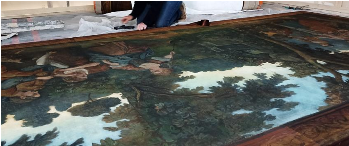
Détrempe du XVIII e , conservée à la mairie de Grasse

La désignation « peinture mate » recouvre un large éventail de matériaux et de techniques comme la détrempe, la gouache ou la tempéra. Mises en œuvre à toutes les périodes, ces dernières offrent au peintre plusieurs avantages : vitalité des tons, rapidité d'exécution et de séchage. De telles peintures se déploient sur une grande variété de supports et de formats. Les traités technologiques anciens, comme les écrits d'artistes, rendent compte d'un usage courant de ces matériaux aux périodes médiévale et moderne et d'un intérêt marqué par les artistes expérimentateurs des XIX e et XX e siècles.