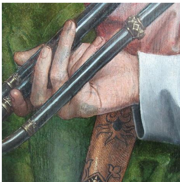
Détail Hans Memling Anges musiciens , KMSKA (C. Betelu)

Les altérations chromatiques dans la peinture de chevalet renvoient à des phénomènes physico-chimiques au sein de la couche picturale. Ces mécanismes peuvent concerner plus spécifiquement les couches colorées ou se limiter au vernis. Ils peuvent résulter d'une réaction chimique modifiant la composition des matériaux et/ou d'un changement d'état physique de la matière, engendrant une interaction différente avec la lumière. Perte d'intensité ou changement de couleur, jaunissement, blanchiment, opacification, brillance ou matité accrues, ces modifications trouvent leurs origines dans la fragile nature de certains matériaux mis en œuvre par les peintres. Ils s'altèrent sous l'impact