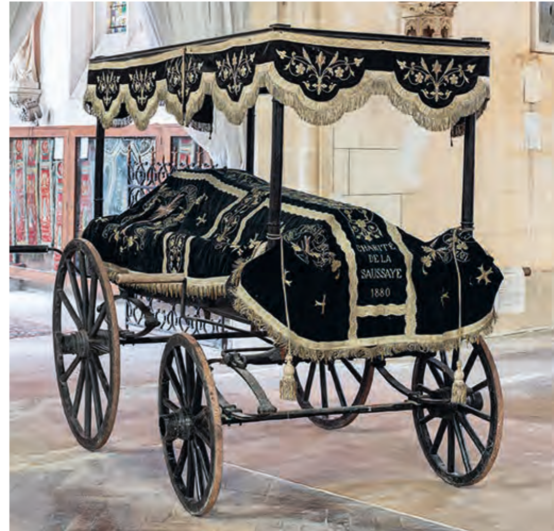
DRAP MORTUAIRE. 1880, collégiale, La Saussaye (Eure).

Le cortège funèbre, strictement composé depuis le Moyen Âge, s'enrichit à partir du XIX e siècle de représentants de différents groupes sociaux. Comme les