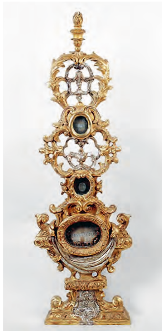
RELIQUAIRE. Reliquaire contenant les reliques des saints Fructueux, André, Étienne, Philippe Néri, Anselme, Rémi, Gaudens et de sainte Salvata, 2 e moitié du xvii e siècle, église Saint-Thomas, La Flèche (Sarthe).