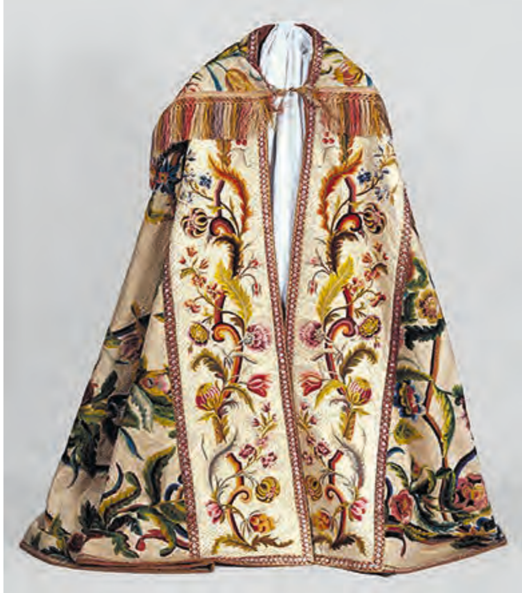
CHAPE. xix e siècle?, chapelle des pénitents blancs, Saint-Crépin (Hautes-Alpes).