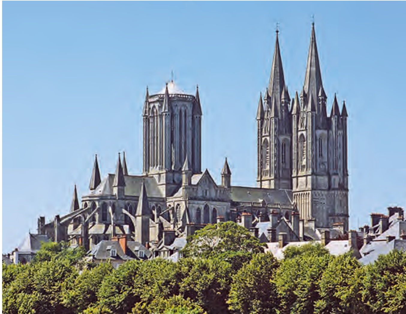
CATHÉDRALE. XII e siècle, Coutances (Manche).