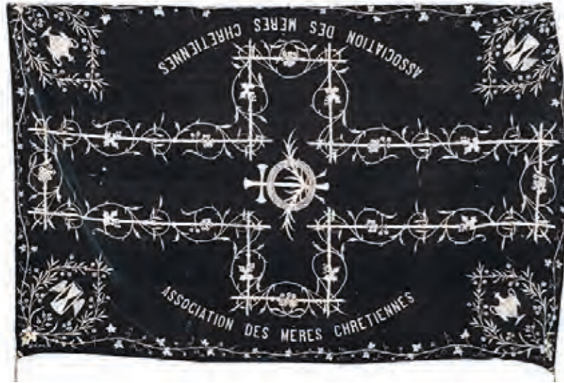
DRAP D'HONNEUR. 2 e moitié du XIX e siècle, église Saint-Dizaint, Ardes (Puy-de-Dôme).