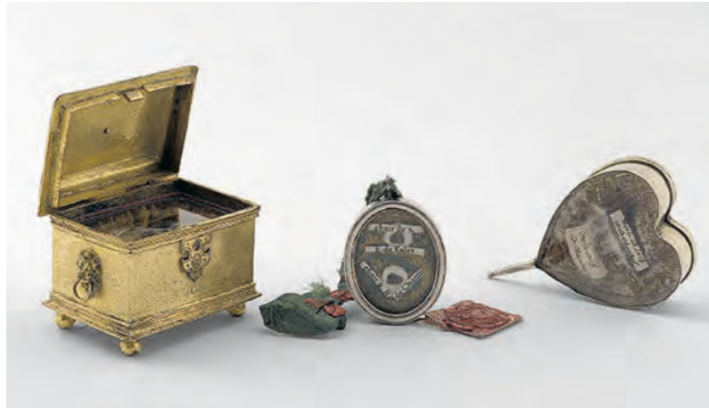
THÈQUE. ENCOLPION. BOÎTE DE RELIQUAIRE. Deux thèques, dont un encolpion (au centre), dans un coffret : reliques de saint François de Sales et sainte Jeanne de Chantal, 4 e quart du xvii e siècle, église Saint-Pierre, Montbrison (Loire).