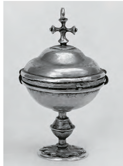
CIBOIRE DES MALADES g. n. m.