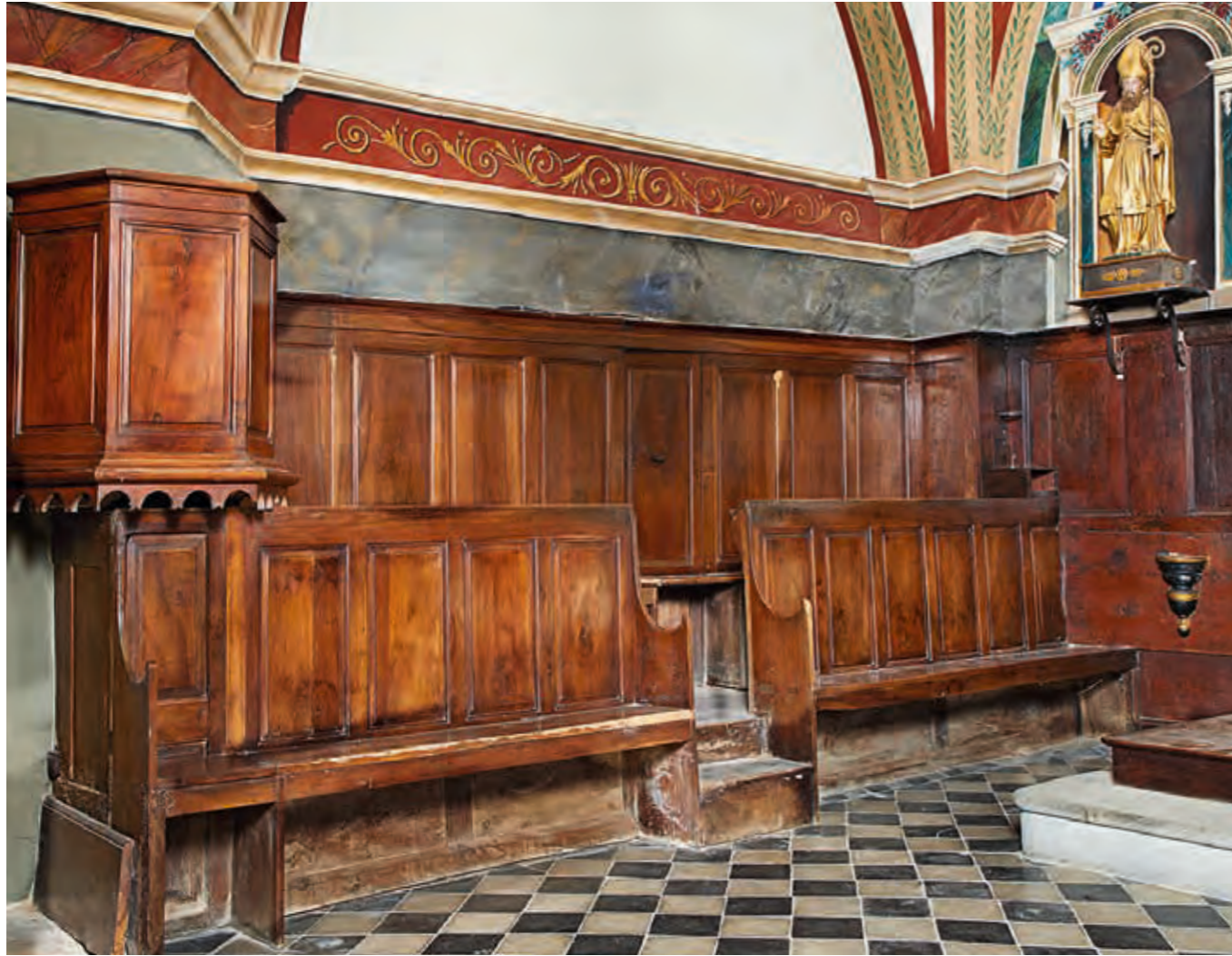
BANC DE CHŒUR. XIX e siècle, église Saint-Sidoine, Brantes (Vaucluse).